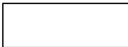
Stempel der Organisation

In jedem Unterschriftenfeld ist eine Namenswiederholung in Druckbuchstaben notwendig.